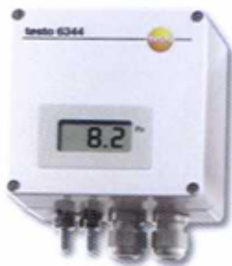
TESTO 6344 - 0555-6344 Transmissor de AP de 0 a 50 Pa Com Visualizador