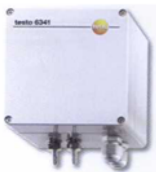
TESTO 6341 - 0555-6341 Transmissor de AP de 0 a 10 Pa Ajuste Automático Sem Visualizador