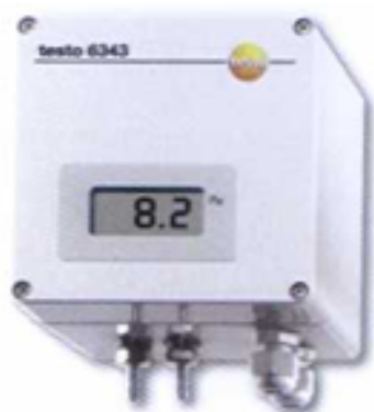
TESTO 6343 - 0555-6343 Transmissor de AP de 0 a 10 Pa Ajuste Automático Com Visualizador