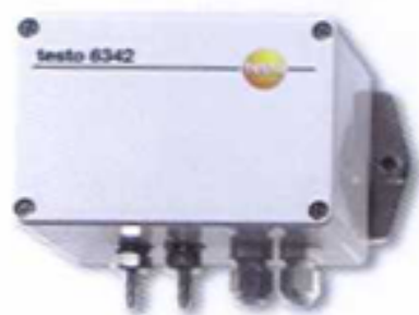
TESTO 6342 - 0555-6342 Transmissor de AP de 0 a 50 Pa Sem Visualizador